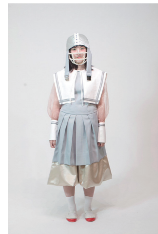
空間演出デザイン