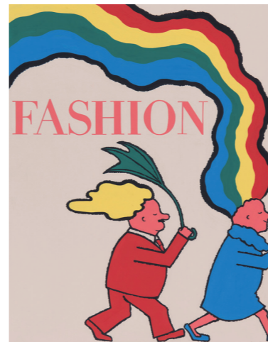
グラフィックデザイン