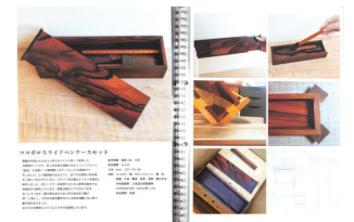
工芸工業デザイン