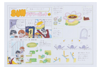
プロダクトデザイン

この講座は、特に志願者の多い多摩美術大学のグラフィックデザイン学科と生産デザイン学科および、武蔵野美術大学の工芸工業デザイン学科と空間演出デザイン学科の総合型選抜・学校推薦型選抜試験対策の講座です。