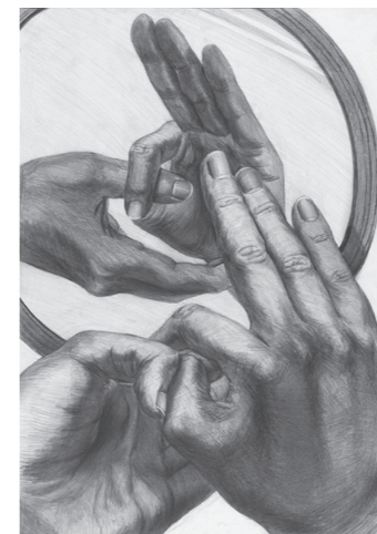
グラフィックデザイン