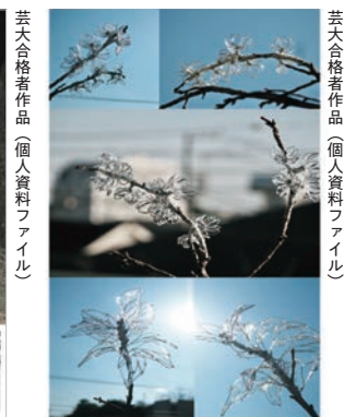
芸大合格者作品(個人資料ファイル)