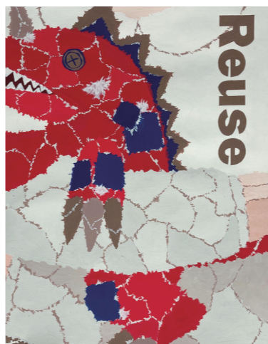
グラフィックデザイン