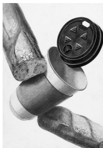
プロダクトデザイン