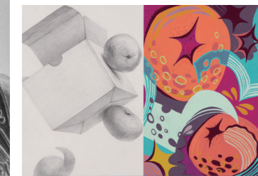
テキスタイルデザイン

この講座は、特に志願者の多い多摩美術大学のグラフィックデザイン学科と生産デザイン学科および、武蔵野美術大学の工芸工業デザイン学科と空間演出デザイン学科の総合型選抜・学校推薦型選抜試験対策の講座です。