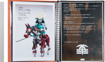
工芸工業デザイン