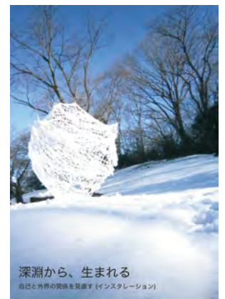
芸大合格者作品(個人資料ファイル)