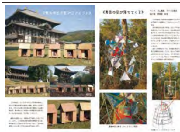
2018年度 東京藝術大学 先端芸術表現科 合格者作品(作品ファイル)