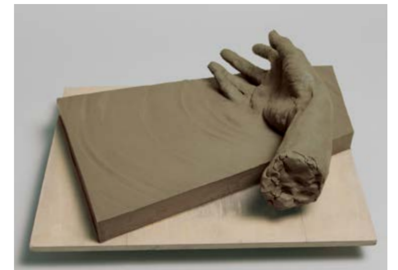
立体表現(手と任意の形態)