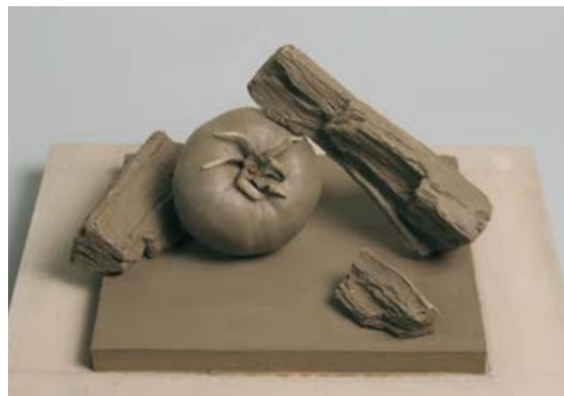
立体表現(トマトと炭)