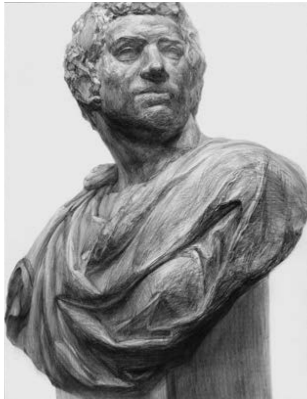
デッサン(ブルーナス)