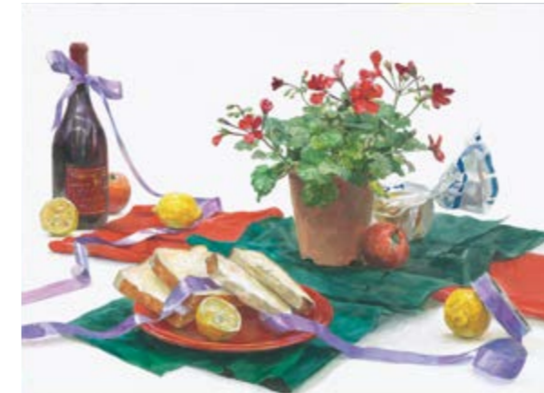
日本画科 東京藝術大学合格者 作品