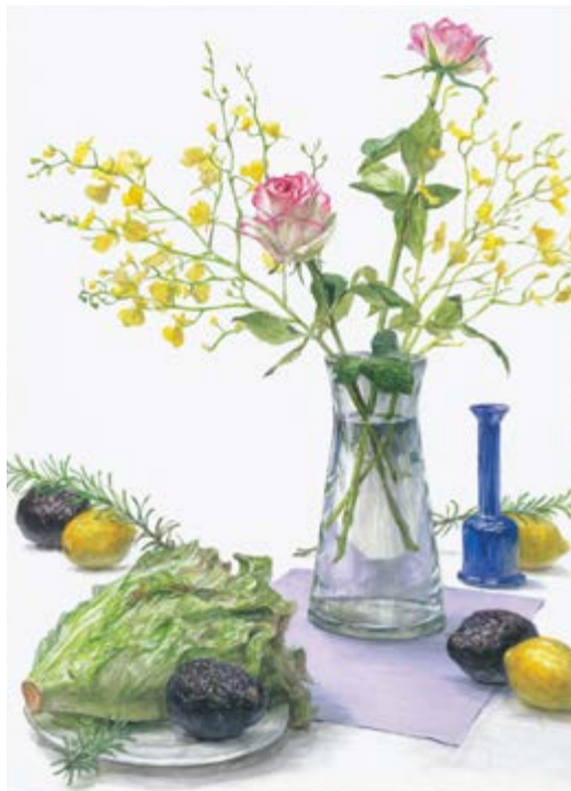
日本画科 東京藝術大学合格者 作品 コンクール上位作品