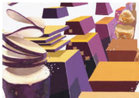
デザイン 工芸 平面構成