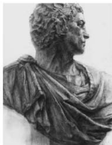
デッサン デッサン(木炭)